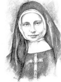
Mutter Franziska Schervier

Dem Auftrag von Mutter Franziska Schervier folgend, wollen die Armen-Schwestern vom hl. Franziskus durch die Gründung eines Vereins ihr bisheriges Engagement festigen und auf Zukunft hin die Unterstützung der caritativen Dienste der katholischen Kirche in Westsibirien sichern.