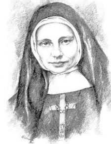
Mutter Franziska Schervier

Dem Auftrag von Mutter Franziska Schervier folgend, wollen die Armen-Schwestern vom hl. Franziskus durch die Gründung eines Vereins ihr bisheriges Engagement festigen und auf Zukunft hin die Unterstützung der caritativen Dienste der katholischen Kirche in Westsibirien sichern.